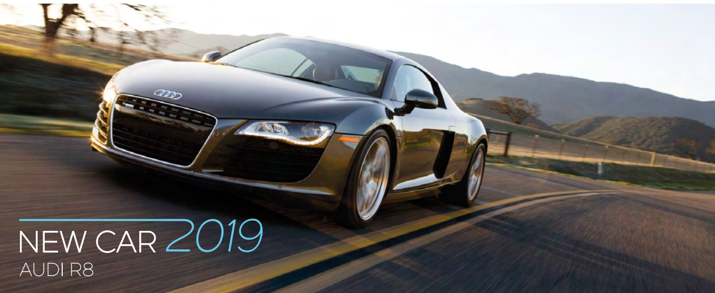
NEW CAR 2019 AUDI R8