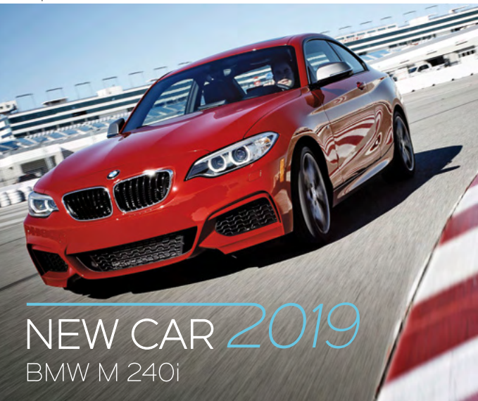
NEW CAR 2019 BMW M 240i